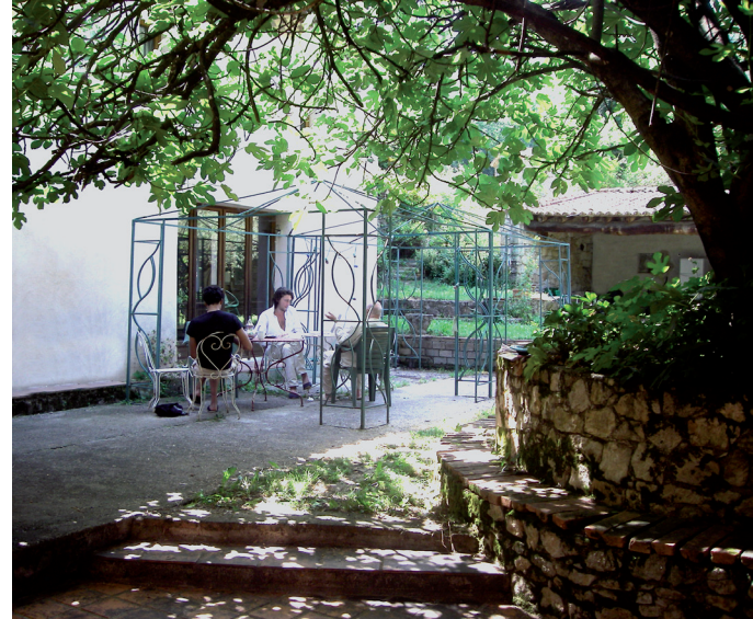
Table d'hôte chaleureuse et équilibrée.

Les trois repas sont servis dans une cour ombragée.