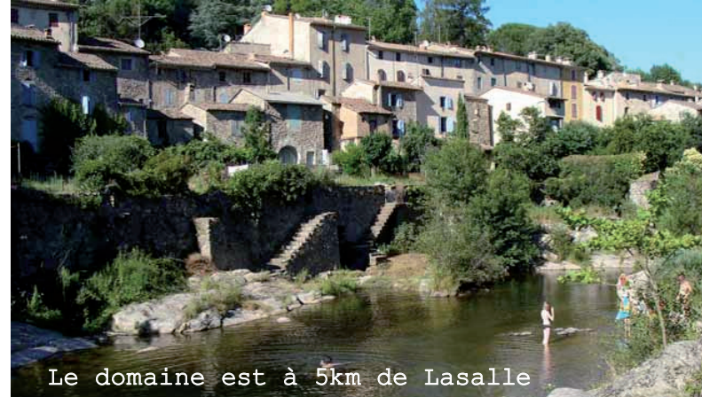
Le domaine est à 5km de Lasalle

réglement: 25% lors de la réservation, le complément au 1er Aout.